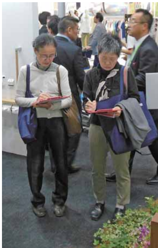
▲各展示会などでは加齢配慮仕様に中高年が高い関心を示す。車いすの使用に配慮し屋内と屋外で段差のないバリアフリーの仕組みも▼