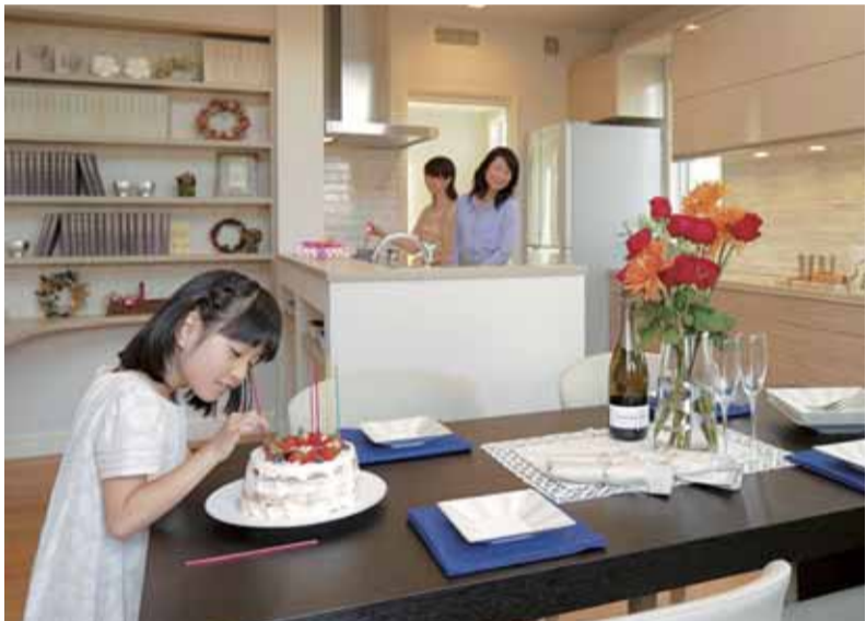
▲共通のキッチンによる食育も多世帯住宅のメリット。家族団らんの調理は最新機能を搭載したシステムキッチンで▼