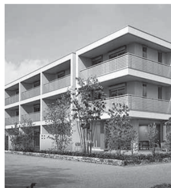
賃貸住宅 (シニア向け)

高い防災力をもつ安全安心な 賃貸住宅経営。 狭小の住宅地から大規模な 敷地まで対応可能です。