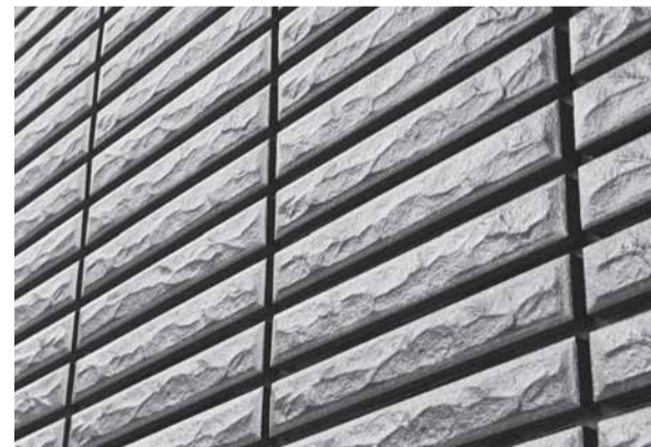
キラテックタイル