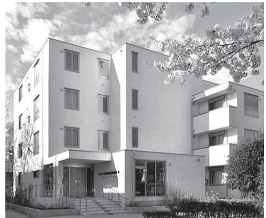
お部屋探し(シニア向け)