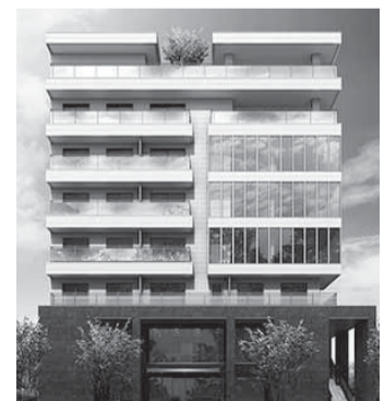
中高層ビルディング

超高齢社会のニーズを捉えた 賃貸住宅経営。 土地活用をとおして社会に 貢献できます。