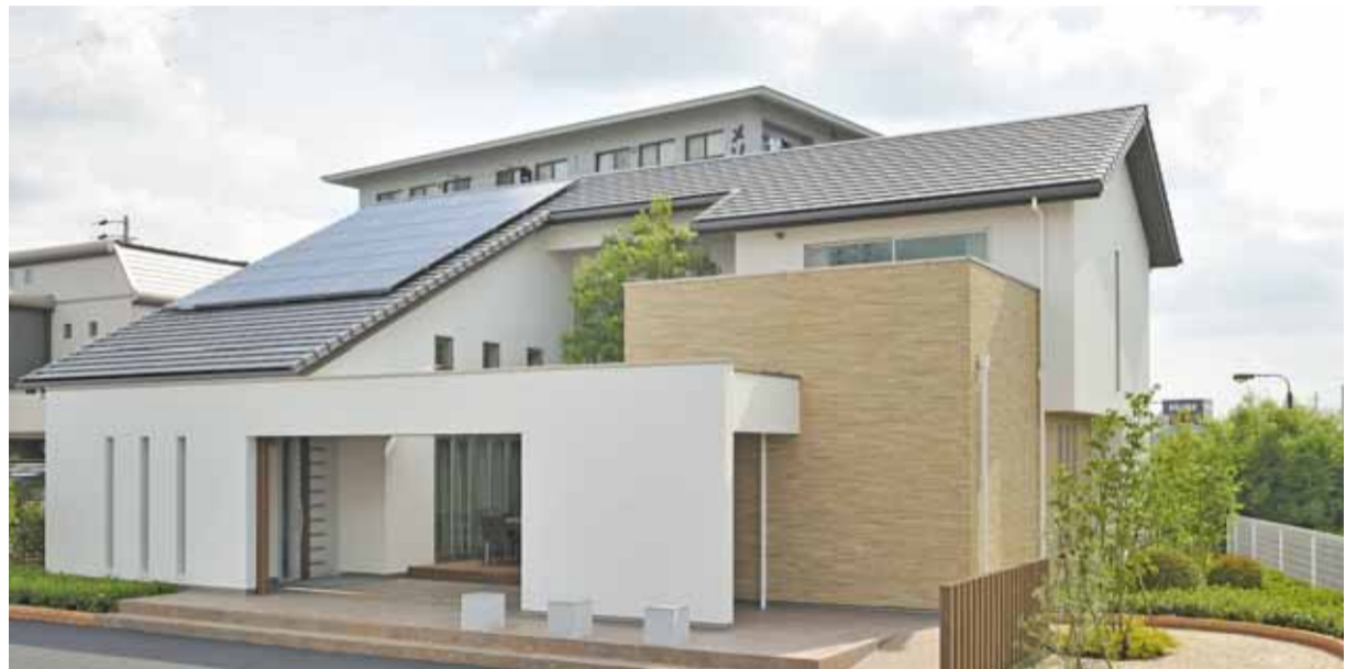
アエラホームのZEH対応住宅「クラージュ」（岐阜瑞穂店）

内の温度差が健康に与えるダメージは想像以上に大きいものがあり、住宅の性能から健康を考えることも必要なことといえるのです。