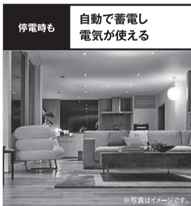
太陽光+蓄電システム