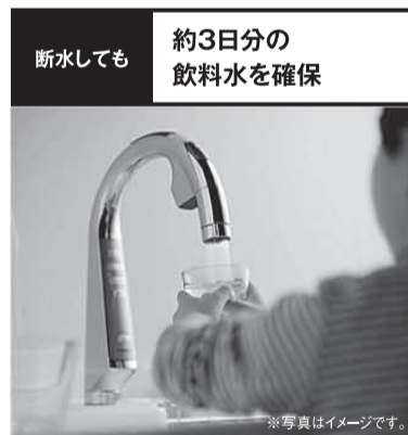
貯水タンク「マルチアクア」