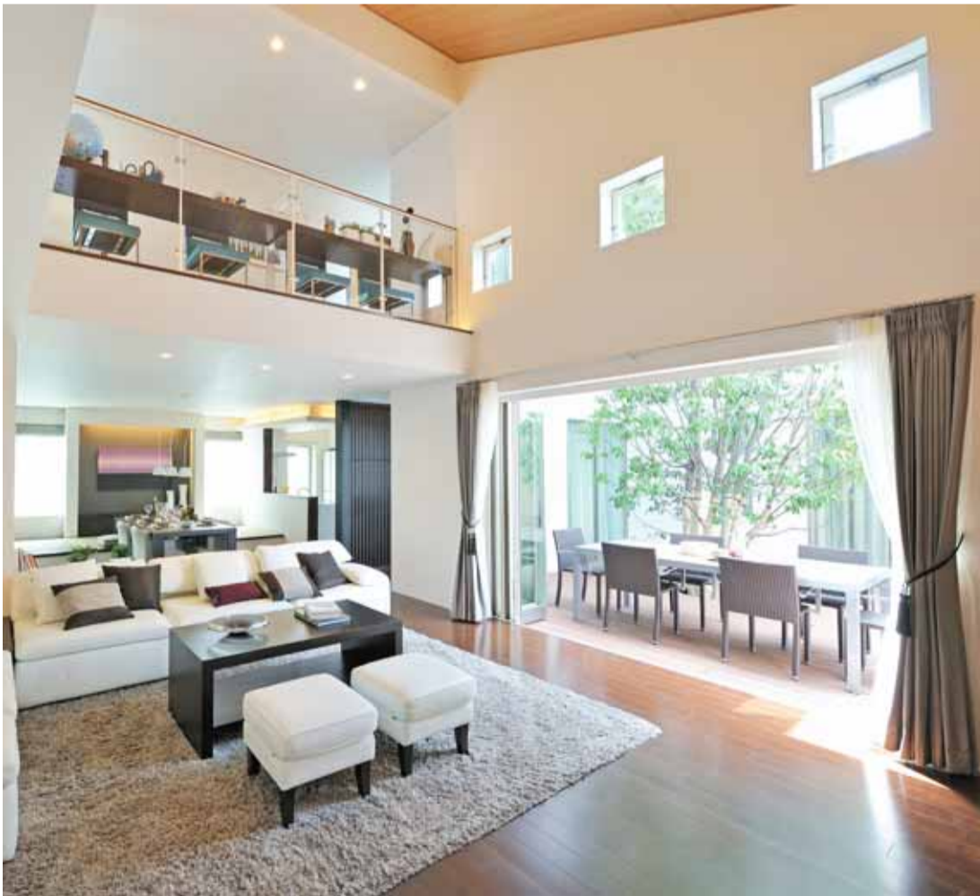
高気密・高断熱の住宅だからできる吹き抜け・大開放のゆとりある空間構成